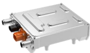
水加熱ヒーター Electric Coolant Heater