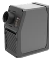
小型スポットクーラー Spot Cooler