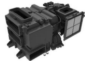
HVAC ※ Heating, Ventilation and Air Conditioning Unit

本展示会ではお客様にIntegrated Thermal Management System (以下、ITMS) の冷やす、温める技術を体験して頂きたいと体験型展示物として、ITMSで作られた冷水、温水を実際にご覧いただけます。ぜひ、弊社のコンセプトである、「Create THE FUTURE SCENES」を体感しにお越しください。