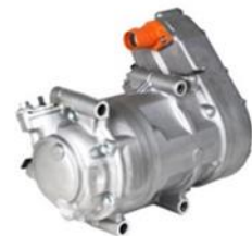
電動コンプレッサー Electric Compressor