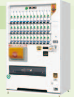
災害対応自動販売機 エネレンジャー

店舗システムと自動販売機の分野を中心に、食品の流通ビジネスを支えています。店舗用冷凍・冷蔵ショーケースの製造、店舗の企画・設計から施工・メンテナンスまでのライフサイクルをフルサポートしています。