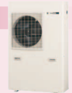
CO 2 ヒートポンプ式 温水暖房機

快適・省エネルギーを実現させるヒートポンプ技術を使った給湯機「エコキュート」*や温水暖房機などの製品を開発・製造し、サンディンググループの先進技術を暮らしの基本である住まいにも活かしています。